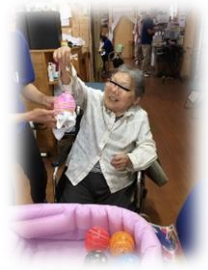
祭りの定番 ”ヨーヨー釣り”