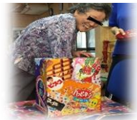
お菓子のつかみ取り。 『孫に持ち帰るぞ～』