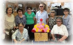
『林檎館みこし』を 囲んで記念撮影